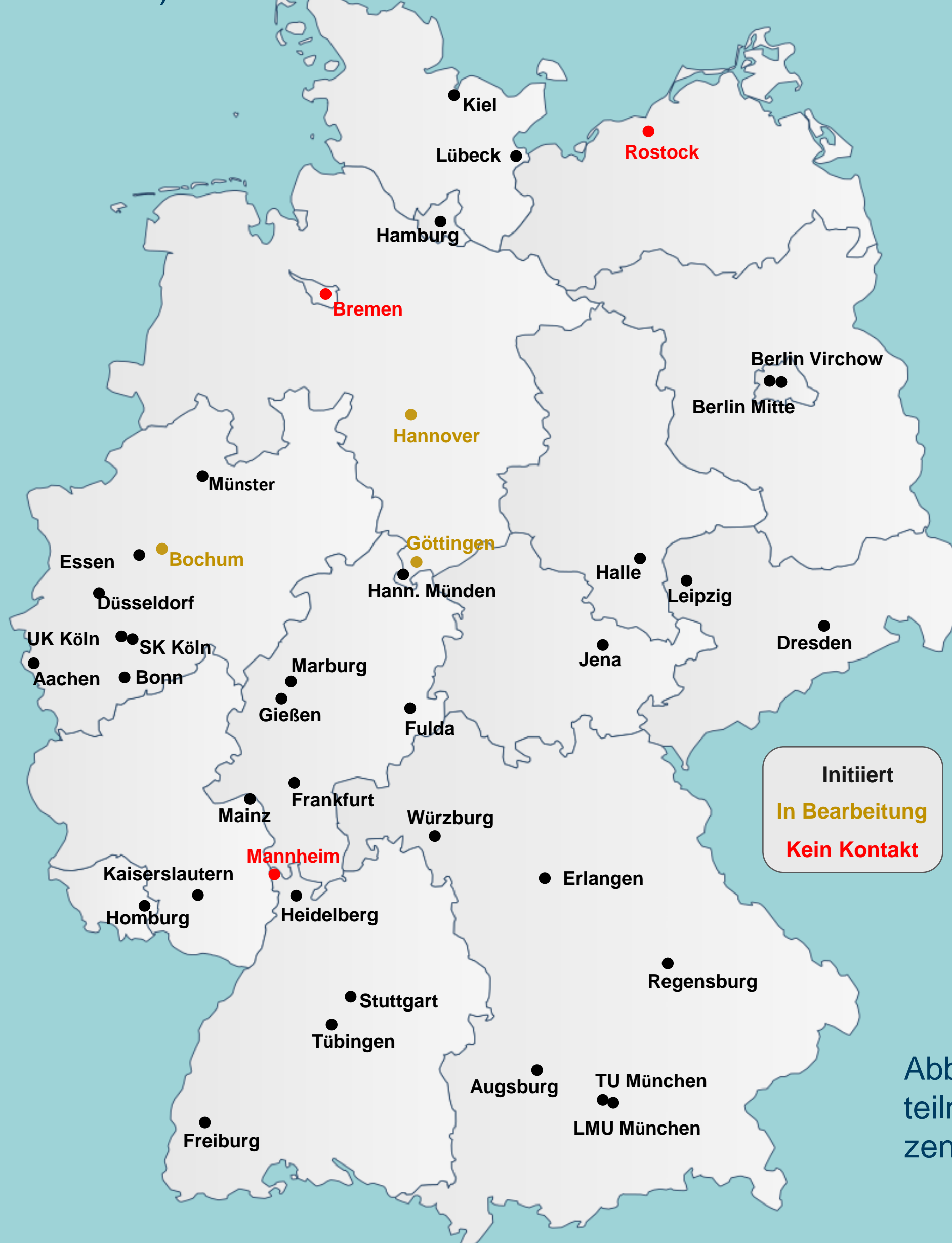
Abb. 1: Am SOLKID-GNR teilnehmende Transplantationszentren (Stand: 22. Okt. 2023).

Bislang konnten 877 Lebendspender ins SOLKID-GNR aufgenommen werden (Stand 22. Okt. 2023).