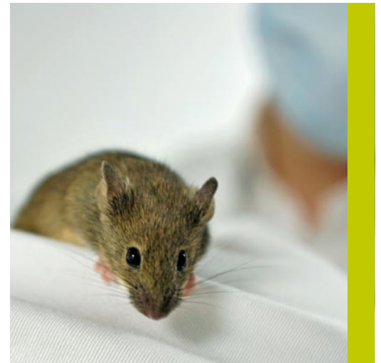
Die erste gentechnisch arthrosefrei gemachte Maus freut sich über den medizinischen Fortschritt.

Die insgesamt dreieinhalb Jahre dauernde Studie des internationalen Forscherteams zeigt nicht nur einen bisher unbekanntem, jedoch entscheidenden Weg, über den Arthrose entsteht: Sie entwickelt zugleich auch eine Strategie für deren medikamentöse Behandlung. Dazu haben die Forscher